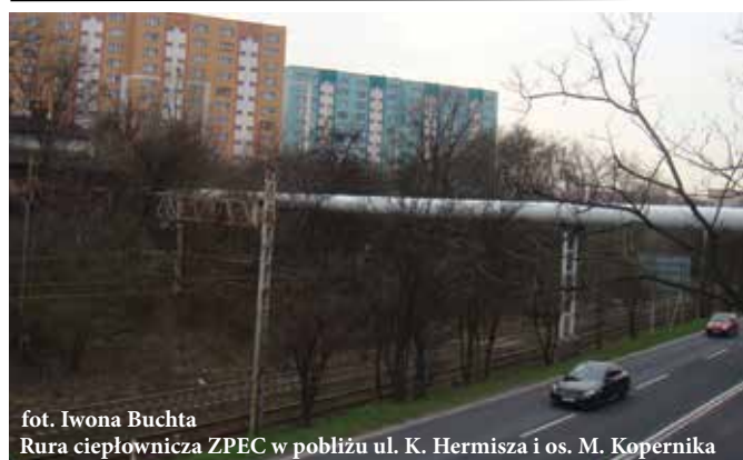
Rura ciepłownicza ZPEC w pobliżu ul. K. Hermisza i os. M. Kopernika

„Regulamin zasad rozliczania kosztów zakupu energii cieplnej na cele centralnego ogrzewania i jego zużycia na potrzeby podgrzania wody oraz dokonywania rozliczeń z użytkownikami lokali w Zabrzeńskiej Spółdzielni Mieszkaniowej“ dostępny jest między innymi na e-kartotece.