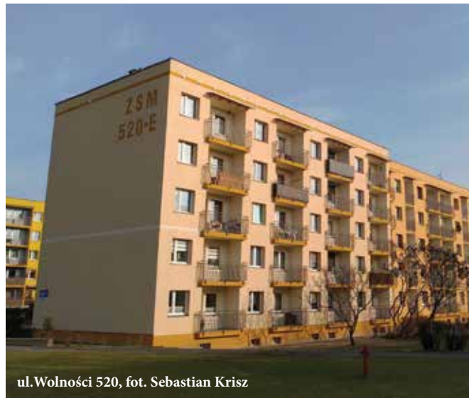
ul. Wolności 520