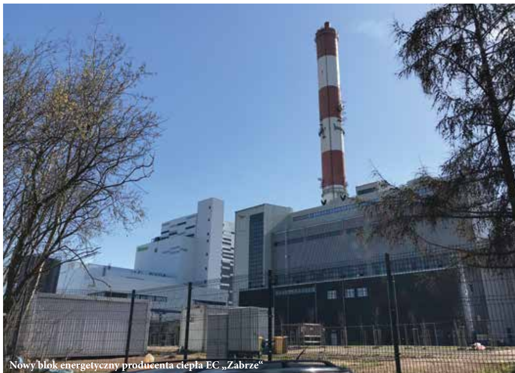
Nowy blok energetyczny producenta ciepła EC „Zabrze“