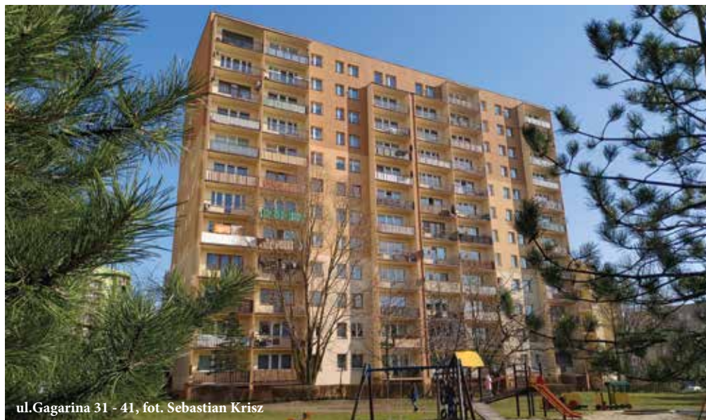
ul. Gagarina 31 - 41

O wykorzystaniu środków finansowych z funduszu remontowego mówić będzie na walnym zgromadzeniu dyrektor ds. technicznych ZSM, Grażyna Gorzelska : – Poinformuję członków spółdzielni między innymi o tym, że w 2018 roku najwięcej środków - 53,51%, przeznaczyliśmy na prace elewacyjne. Prowadzone były na 25 budynkach, zakończyliśmy ocieplenie 22 z nich. W sumie, od rozpoczęcia termomodernizacji do końca ubiegłego roku, z 214 budynków, którymi zarządzamy 180 ociepliliśmy w całości (84%), w 32 po trzy ściany (15%), w 1 dwie (0,5%). Termomodernizacja tylko jednego budynku, obłożonego płytami cementowo-azbestowymi, nie była rozpoczęta (0,5%); spółdzielnia zaplanowała ją na rok bieżący. Największa część pozostałych środków z funduszu remontowego przeznaczona została na roboty instalacyjne - 20,22% (głównie wodno-kanalizacyjne, ale też na związane z centralnym ogrzewaniem i centralnie ciepłą wodą oraz elektryczne). Na prace drogowe wydaliśmy 6,39% środków z funduszu, na malarskie 5,73%, murarskie 5,33%, na dekarsko-błacharskie