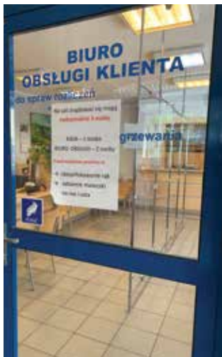
Biuro Obsługi Klienta w ZSM, ul. Ślęczka 1