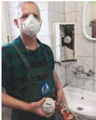
Pracownicy ZSM wymieniają uszkodzone wodomierze