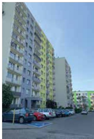
Ściany zewnętrzne, balkony i dachy już sprawdzone