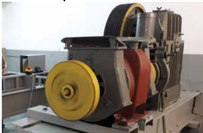
Zespół napędowy windy