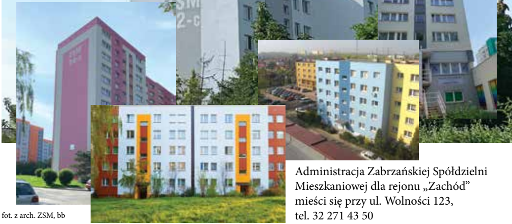
fol. z arch. ZSM, bb

2556 mieszkań w 45 wielorodzinnych budynkach. 5031 osób ma w nich swój dom.