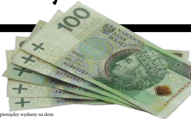
Więcej pieniędzy wydamy na dom dok. ze str. 1

miesiące przed zmianą opłat musimy informować o nich mieszkańców). Rozliczamy je w oparciu o faktyczne zużycie mediów oraz ceny ustalane przez producentów i dostawców. Wniezione na poczet zapłaty za wodę i odprowadzanie ścieków rozliczamy co pół roku, a pozostałe - za ciepło, gaz prąd - raz w roku. Niedawne podwyżki opłat za media przerosły nasze ubiegłoroczne szacunki, z wyjątkiem tych za wodę (nie musieliśmy ich szacować, zostaliśmy o nich powiadomieni już w 2018 roku, gdy zatwierdzono trzyletnie taryfy Zabrzańskiego Przedsiębiorstwa Wodociągów i Kanalizacji). - Czy to znaczy, że niektóre podwyżki obowiązujące od maja i czerwca mieszkańcy odczują dopiero w przyszłym roku? - Tak, zapewne niewielkie będą nadpłaty w rozliczeniach zużycia mediów za 2020 rok. Oby jak najmniej osób stanęło przed koniecznością dopłaty do sumy zaliczek. Wydatki na utrzymanie mieszkań w przyszłym roku