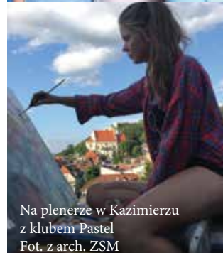
Na plenerze w Kazimierzu z klubem Pastel