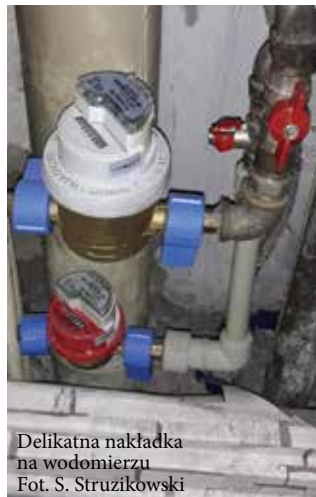
Delikatna nakładka na wodomierz

Zawiadomienia o rozliczeniu kosztów dostawy wody, jej podgrzania i odprowadzenia ścieków Zabrzeńska Spółdzielnia Mieszkaniowa dostarczyła we wrześniu do wszystkich mieszkań w budynkach, którymi zarządza. Podstawą rozliczeń jest zużycie ciepłej i zimnej wody między 1 stycznia a 30 czerwca br., zarejestrowane przez wodomierze główne w poszczególnych budynkach oraz indywidualne w lokalach.