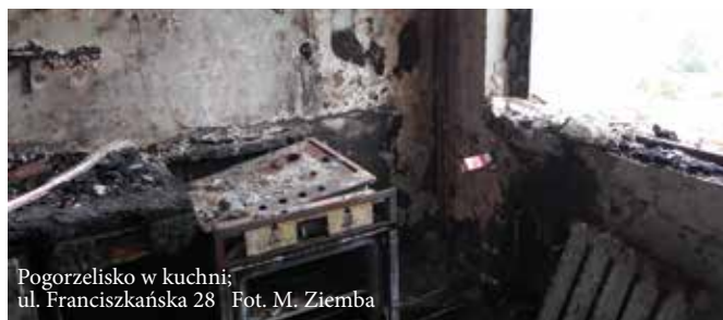
Pogorzeliśko w kuchni; ul. Franciszkańska 28

Pożar u starszej, mieszkającej samotnie osoby, jej zgon i straty materialne w budynku były tematem naszych rozmów także z pracownikami kilku spółdzielczych administracji. Pytaliśmy, czy mają wiedzę o samotnych mieszkańcach, a także o niesprawnych