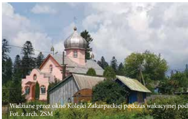
Widziane przez okno Kolejki Zakarpackiej podczas wakacyjnej podróży z Kwadratem