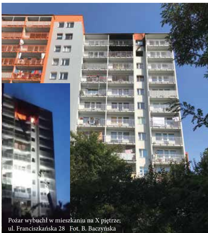
Pożar wybuchł w mieszkaniu na X piętrze; ul. Franciszkańska 28

o stratach, odpowiedzialności, ubezpieczeniu, naprawie szkód i osobach wymagających pomocy