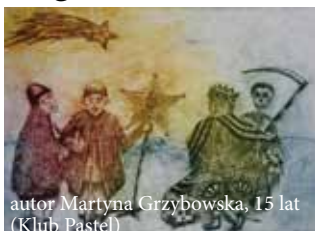
autor Martyna Grzybowska, 15 lat (Klub Pastel)

Świąt białych, pachnących choinką, skrzypiących śniegiem pod butami, spędzonych w ciepłej,